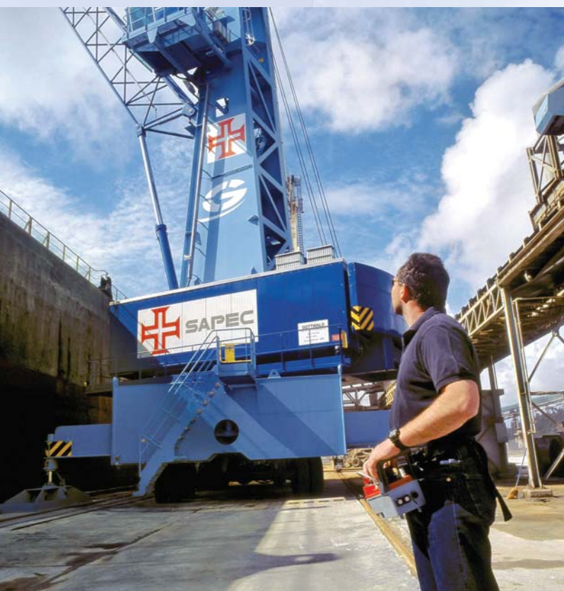
Verfahren und Steuern eines HMK 170 EG via Funkfernsteuerung auf einem engen Kai bei SAPEC, Portugal

Ein Vorteil, der sich auch beim Positionieren des Krans auf engen Kais auszahlt.